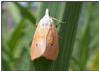
चित्र नं. १: धानको पहेलो गवारोको वयस्क पुतली