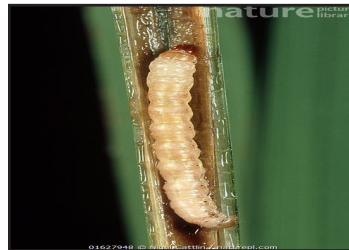
चित्र नं. २: धानको पहेलो गवारोको लार्वा